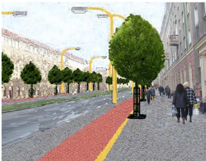
Vizualizace habrů na Hlavní třídě.