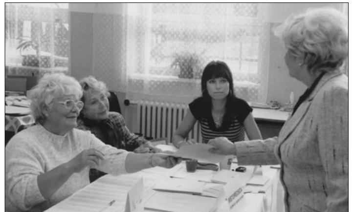
K volbám budou muset voliči přijít znovu. Zasednout však budou muset i všechny volební komise.

Zákon neumožňuje přepočítávání hlasů. Skutečností však je, že Magistrát města Havířova vznesl dotaz na Ministerstvo vnitra a Krajský úřad, zda může být zemřelý na kandidátce a zda hlasy pro něj odezvané započítá. Zákon to totiž