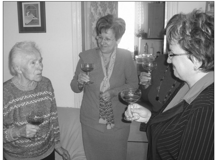
Šampaňské na zdraví.

A zřejmě ví, o čem hovoří. Vždyť pocházela z osmi dětí. Už od dětství