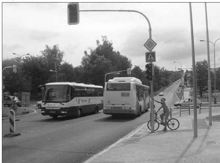
Letní měsíce znamenaly opět velké investice do škol. Celkově za 18 milionů korun byly rekonstruovány kuchyně a jídelny v ZŠ Generála Svobody a ZŠ 1. máje a také v MŠ Občanská.

Světelná křižovatka pod Bludovickým kopcem odstranila dlouholetý problém a zvýšila bezpečnost motoristům.