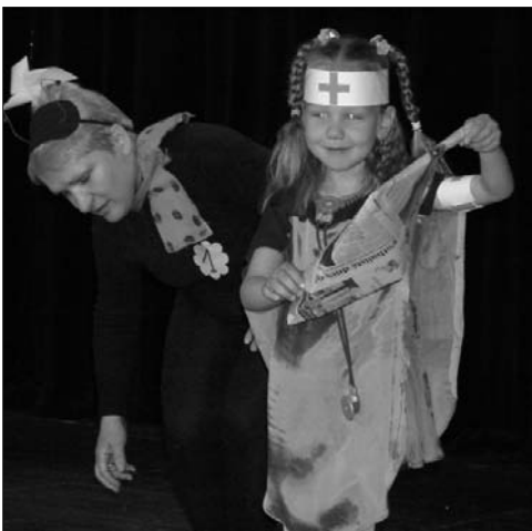
Z loňského ročníku soutěže Já a moje vnuče.

Babičky a dědečkové zbystřete svůj zrak! Třetí ročník soutěže „JÁ a MOJE VNOUČE 2006“ proběhne 21. října 2006 od 16.00 hodin v sále DDM. Vyplněné přihlášky nutno odevzdat do 16.10. 06 u paní Š. Jarošíkové v DDM, kde obdržíte také podrobné informace. Vstupenky v ceně 30 Kč budou k dostání od 1.10. 06 v DDM u pedagogického dozoru, denně od 14.00 do 19.00 hodin.