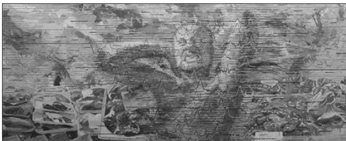
SM /2005, 140x330 cm, akryl/

vernisaž v úterý 3.10. v 17 h, výstava potrvá do 27.10. 2006