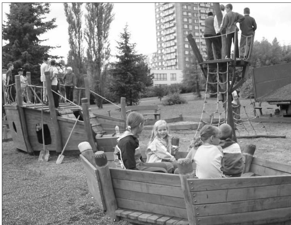
↑ Děti získaly nové hřiště v podobě vraku lodi Bountey.

→ Opravy a předláždění se dočkaly mnohé chodníky a komunikace. Snímek je z ulice J. Gagarina.