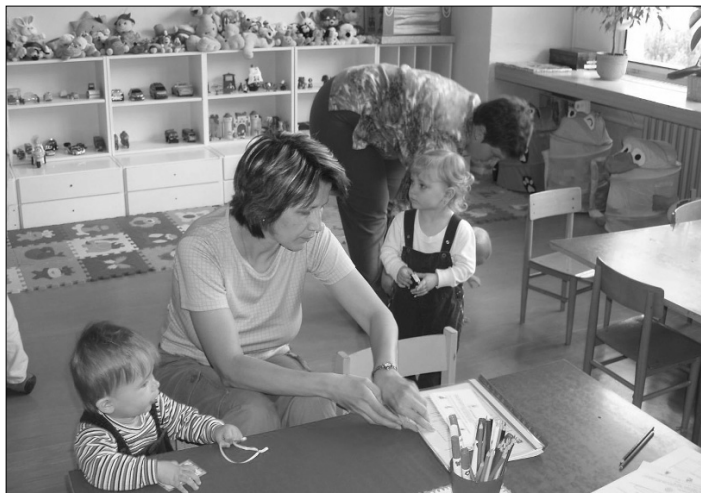
Na Základní škole M. Pujmanové v Havířově-Šumbarku zahájilo činnost Rodinné a mateřské centrum Sluníčko. Již první den si sem našly cestu maminky se svými ratolestmi.

Ano, tady jsme navázali spolupráci s Vysokou školou humanitně-ekonomickou. Je to ryze soukromá škola. Dohodli jsme se, že otevřeme dálkové studium marketingu a managementu a anglické filologie. Výuka bude probíhat v češtině, a to o sobotách a nedělích. Předpokládáme, že budeme mít zhruba čtyři desítky studentů, kteří se rekrutují hlavně z Ostravska. Slavnostní imatrikulace se uskuteční v prostorách naší školy 16. října.