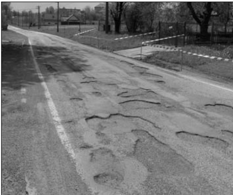
Na Pavlasůvce v Prostřední Suché komunikace připomínala tankodrom.

Především důsledky nebývale dlouhé zimy, ale také dlouhodobě špatný stav některých vozovek a chodníků přiměly zastupitele podstatně zvýšit plánovaný rozsah plošných oprav vozovek a chodníků v tomto roce. K tomu, aby se všechny opravy mohly uskutečnit, bylo třeba navýšit roz-