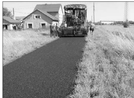
Farská ulice v Bludovicích už má nový kabát.

„Některé akce jsou již hotové nebo se dokončují, další jsou rozpracované. Všechny uvede-