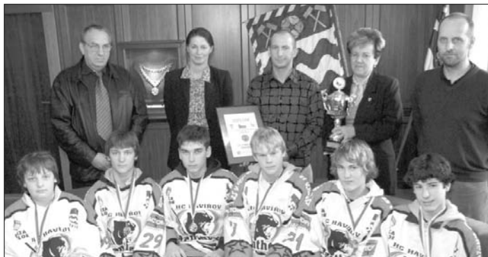
Žáci 8. třídy ZŠ V. Nezvala jsou mistři republiky !

Délka natočených příběhů je cca 35 minut a můžete je zhlédnout dne 20. června v 9.30 hodin a v 11 hodin v loutkovém sále Kulturního domu Petra Bezruče v Havířově - Městě. Vstup je zdarma.