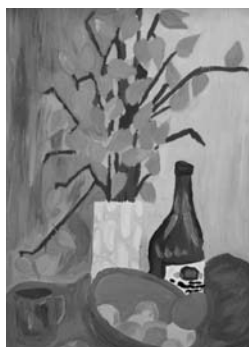
Barbora Kollegová, Zátěší, tempera