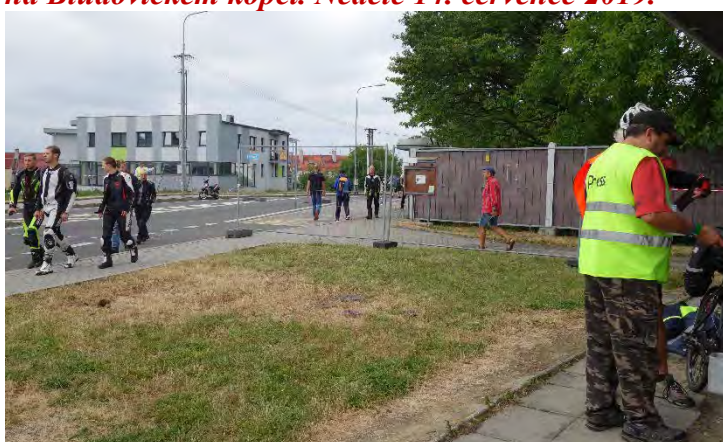
Haviřovský Zlatý kahanec 2019, skončil závod, otvírá se trať. Neděle 14. července 2019.