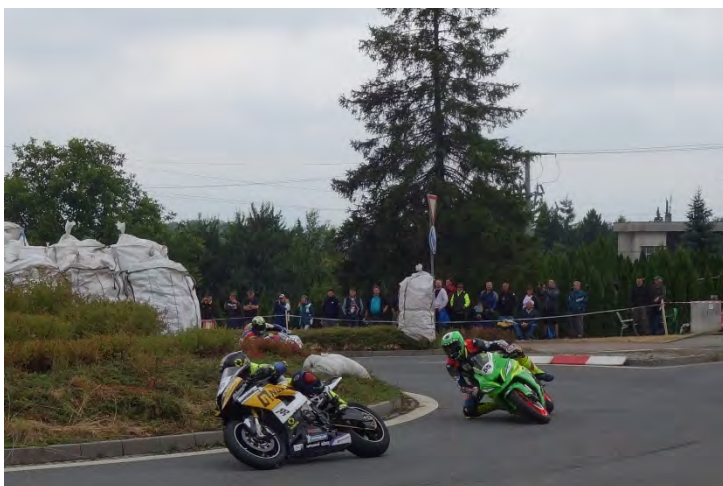
Haviřovský Zlatý kahanec 2019, závod IRRC SB, souboj na kruhovém objezdu na Bludovickém kopci. Neděle 14. července 2019.