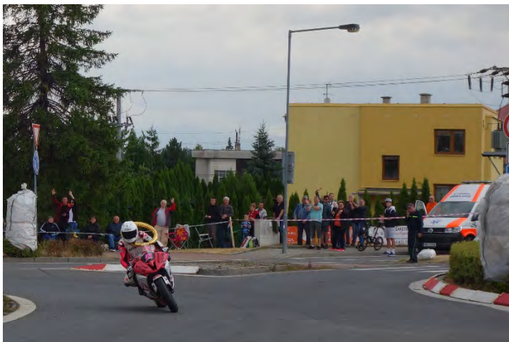
Havířovský Zlatý kahanec 2019, skončil závod do 600 ccm, loučí se Anežka Svobodová. Neděle 14. července 2019.