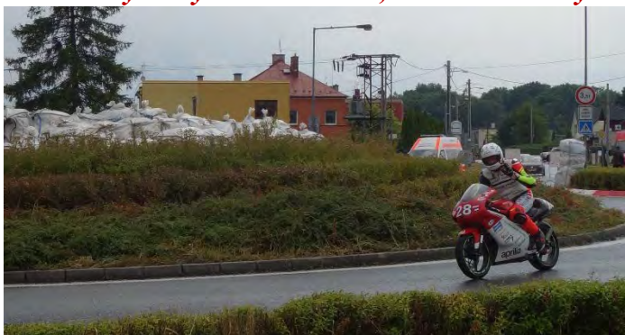
Haviřovský Zlatý kahanec 2019, měřené tréninky v sobotu 13. července 2019.