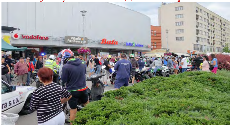
Haviřovský Zlatý kahanec 2019, závodníci se představili veřejnosti u OC Elan.