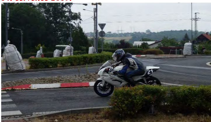
Haviřovský Zlatý kahanec 2019, 125 SP, Petr Martínek se znovu vydává na trať. Neděle 14. července 2019.