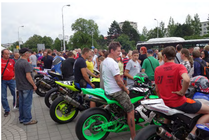
Haviřovský Zlatý kahanec 2019, představení závodníků u OC Elan.