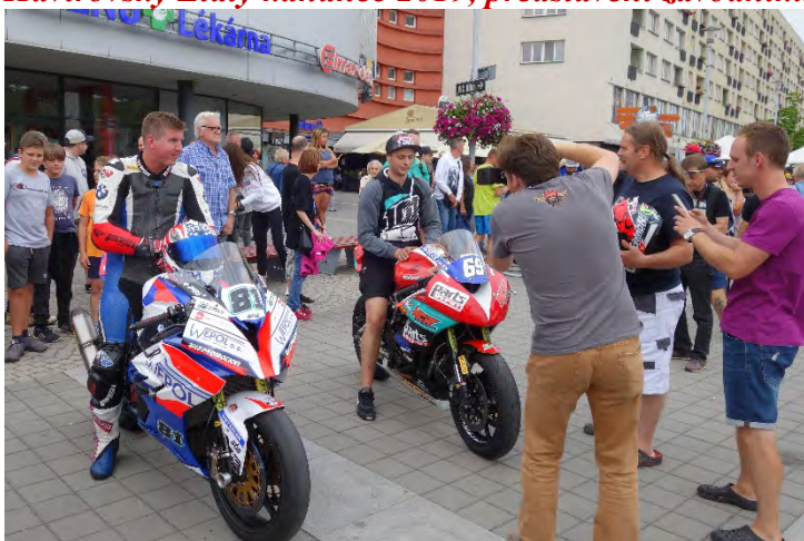
Haviřovský Zlatý kahanec 2019, představení závodníků u OC Elan.