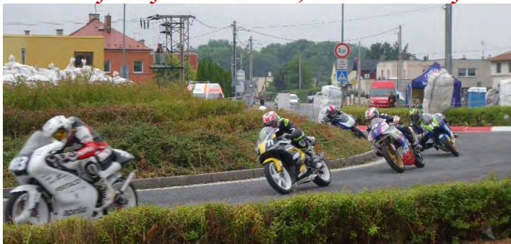
Haviřovský Zlatý kahanec 2019, závod 125 SP, boj na kruhovém objezdu v neděli 14. července 2019.