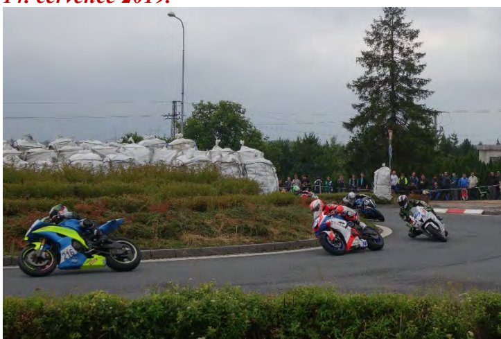
Haviřovský Zlatý kahanec 2019, závod IRRC SSP, souboj na kruhovém objezdu. Neděle 14. července 2019.