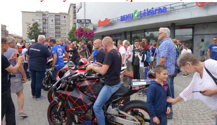
Haviřovský Zlatý kahanec 2019, představení závodníků u OC Elan.