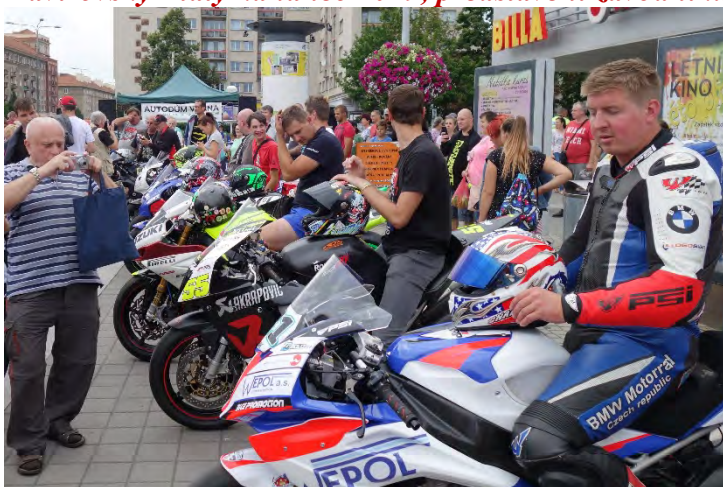
Haviřovský Zlatý kahanec 2019, představení závodníků u OC Elan.