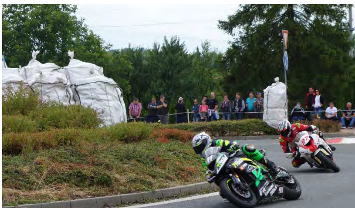
Haviřovský Zlatý kahanec 2019, závod do 600 ccm, soubor mistrů na kruhovém objezdu, neděle 14. července 2019.