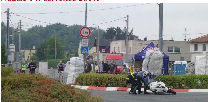
Haviřovský Zlatý kahanec 2019, 125 SP, Petr Martínek a pád bez zranění, neděle 14. července 2019.