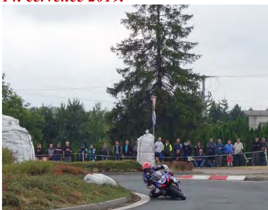
Haviřovský Zlatý kahanec 2019, IRRC SSP, vítěz Matthieu Lagrive na Yamaze. Neděle 14. července 2019.