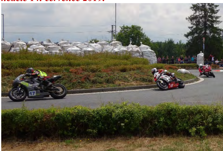
Haviřovský Zlatý kahanec 2019, závod do 600 ccm, soubor mistrů na kruhovém objezdu, neděle 14. července 2019.