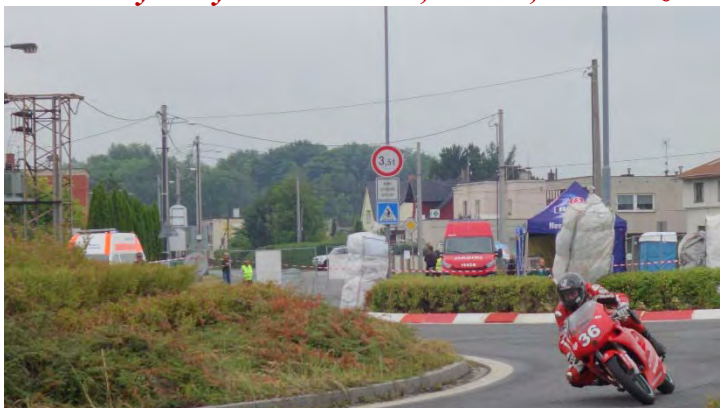
Haviřovský Zlatý kahanec 2019, 125 SP, Petr Hýl, Autodům Vrána, Havířov.