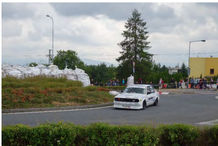
Havířovský Zlatý kahanec 2019, skončil závod do 600 ccm, odjíždí doprovodné vozidlo. Neděle 14. července 2019.