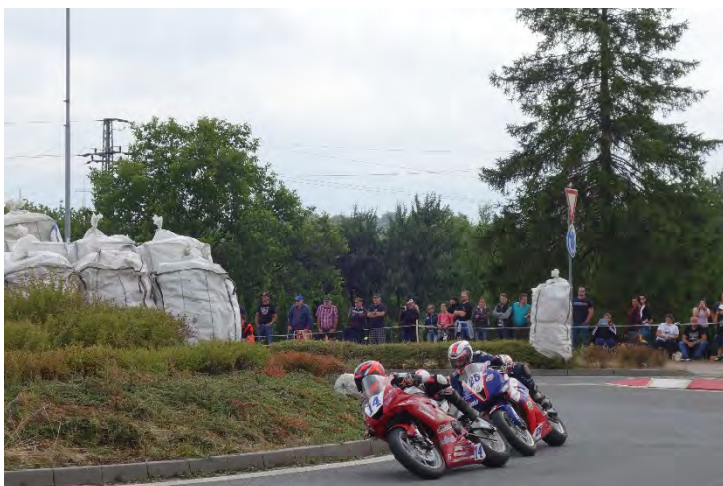
Haviřovský Zlatý kahanec 2019, závod do 600 ccm, Caljouw a Vecko na kruhovém objezdu na Bludovickém kopci. Neděle 14. července 2019.