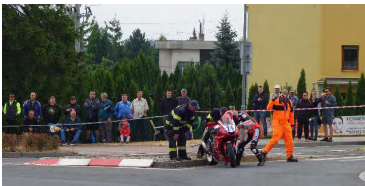
Haviřovský Zlatý kahanec 2019, IRRC SSP, kontrola stroje po pádu Ilja Caljouw. Neděle 14. července 2019.