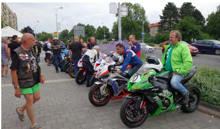
Haviřovský Zlatý kahanec 2019, představení závodníků u OC Elan.