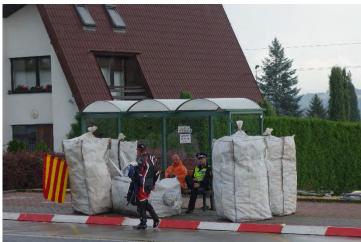
Haviřovský Zlatý kahanec 2019, na trati, měřené tréninky.