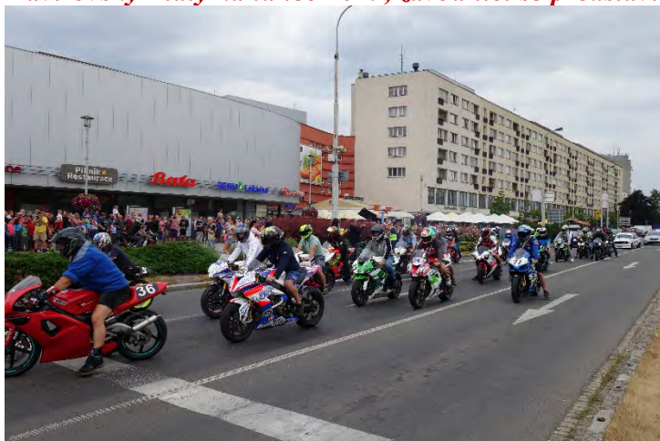
Haviřovský Zlatý kahanec 2019, závodníci se představili veřejnosti u OC Elan.