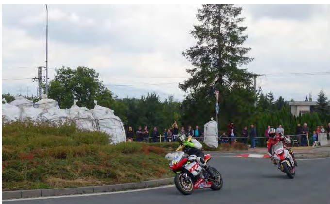
Havířovský Zlatý kahanec 2019, závod do 600 ccm, Tomáš Toth se loučí s diváky. Neděle 14. července 2019.