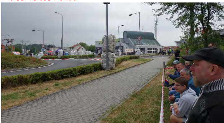
Haviřovský Zlatý kahanec 2019, diváci na Bludovickém kopci, neděle 14. července 2019.