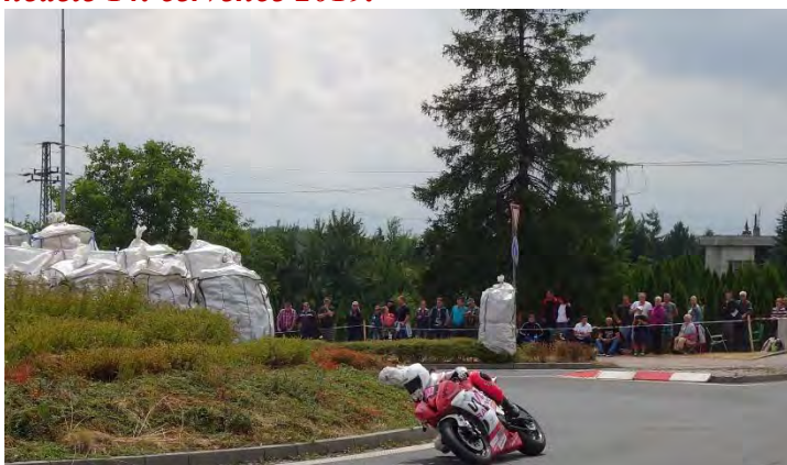
Haviřovský Zlatý kahanec 2019, závod do 600 ccm, v akci Anežka Svobodová. Neděle 14. července 2019.