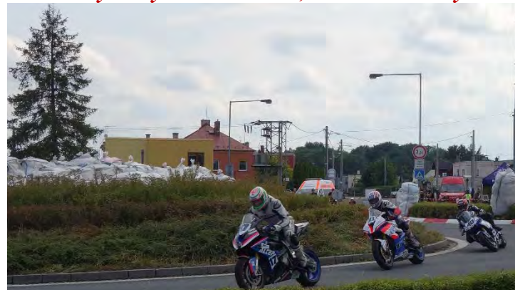
Haviřovský Zlatý kahanec 2019, měřené tréninky v sobotu 13. července 2019.