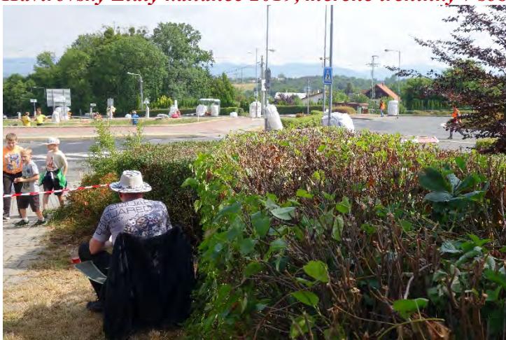
Haviřovský Zlatý kahanec 2019, měřené tréninky v sobotu 13. července 2019. Přestávka.