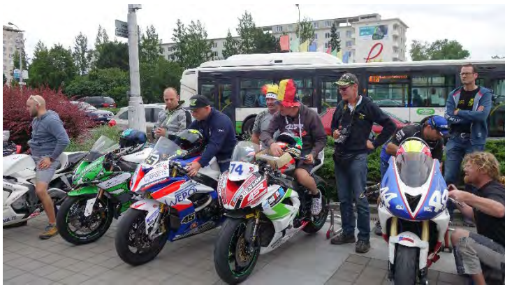
Haviřovský Zlatý kahanec 2019, představení závodníků u OC Elan.