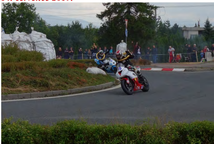
Havířovský Zlatý kahanec 2019, skončil závod do 600 ccm, jezdci se loučí s diváky. Neděle 14. července 2019.