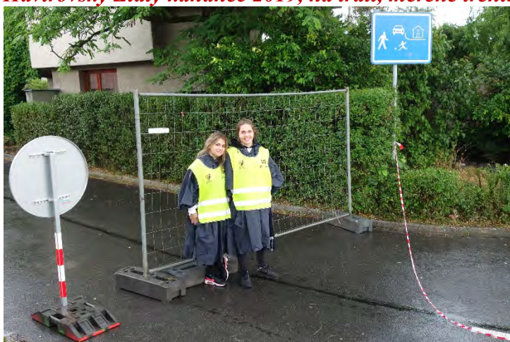
Haviřovský Zlatý kahanec 2019, dobré duše závodu hlídají bezpečnost na trati. Měřené tréninky sobota 13. července 2019. Neustále hrozí déšť.