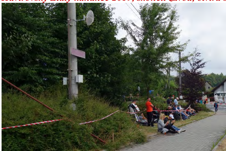
Haviřovský Zlatý kahanec 2019, přestávka mezi závody. Neděle 14. července 2019.