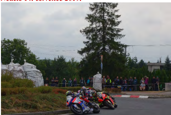
Haviřovský Zlatý kahanec 2019, závod IRRC SB, souboj na Bludovickém kopci. Neděle 14. července 2019.