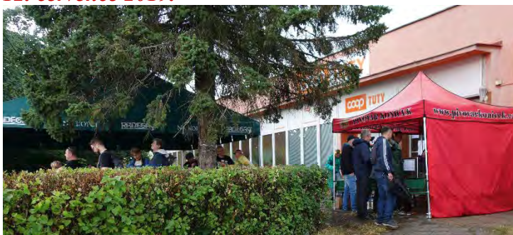
Haviřovský Zlatý kahanec 2019, Bludovický kopec, sobota 13. července 2019, měřené tréninky.