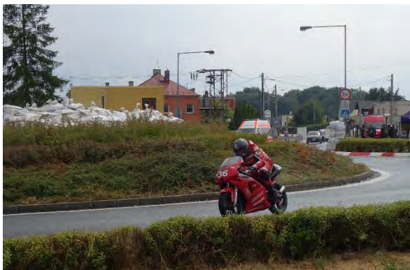
Haviřovský Zlatý kahanec 2019, měřené tréninky v sobotu 13. července 2019.