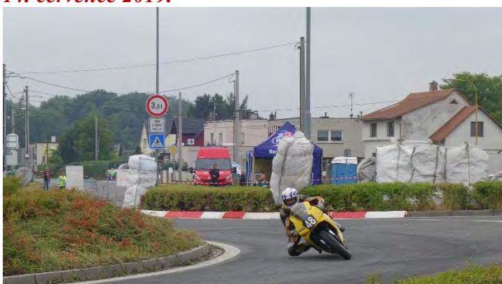
Haviřovský Zlatý kahanec 2019, 125 SP, Ivo Doležal vítěz. Neděle 14. července 2019.