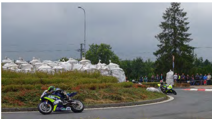
Haviřovský Zlatý kahanec 2019, závod IRRC SSP, souboj na kruhovém objezdu. Neděle 14. července 2019.