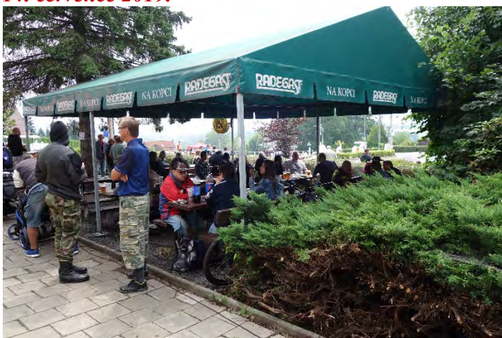
Haviřovský Zlatý kahanec 2019, přestávka mezi závody. Neděle 14. července 2019.