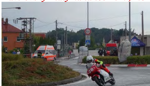
Haviřovský Zlatý kahanec 2019, měřené tréninky v sobotu 13. července 2019.