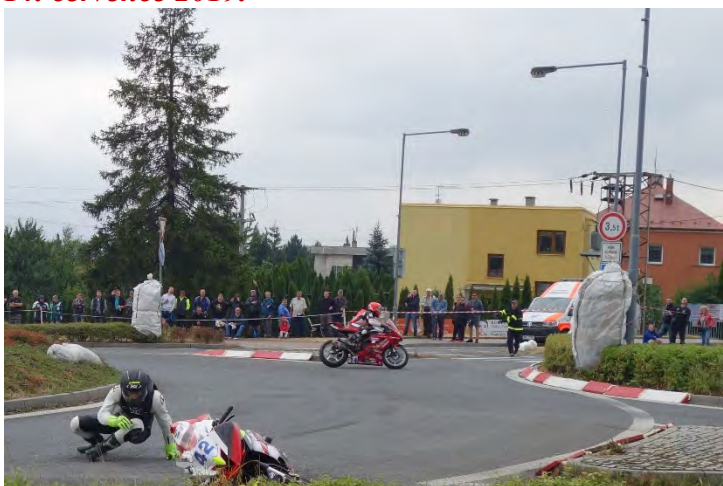
Haviřovský Zlatý kahanec 2019, závod IRRC SSP, Ilja Caljouw jde těž do pádu. Neděle 14. července 2019.