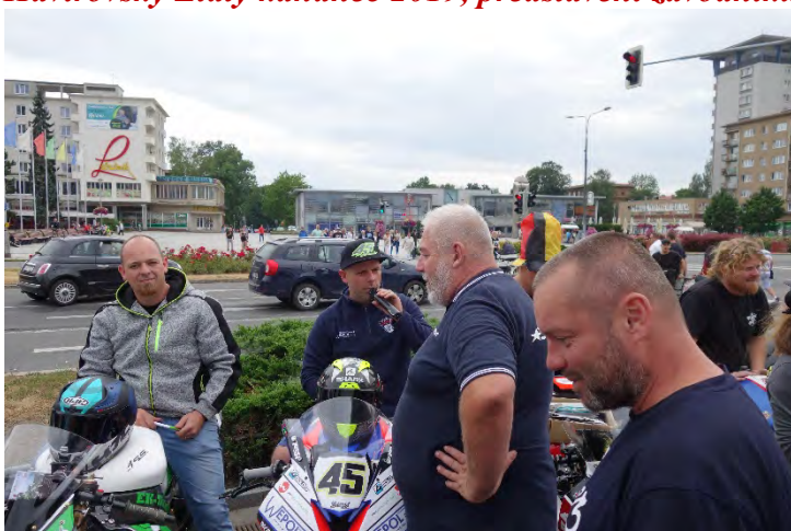
Haviřovský Zlatý kahanec 2019, představení závodníků u OC Elan v pátek 12. července 2019.