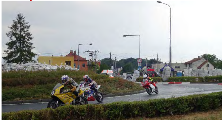
Haviřovský Zlatý kahanec 2019, měřené tréninky v sobotu 13. července 2019.