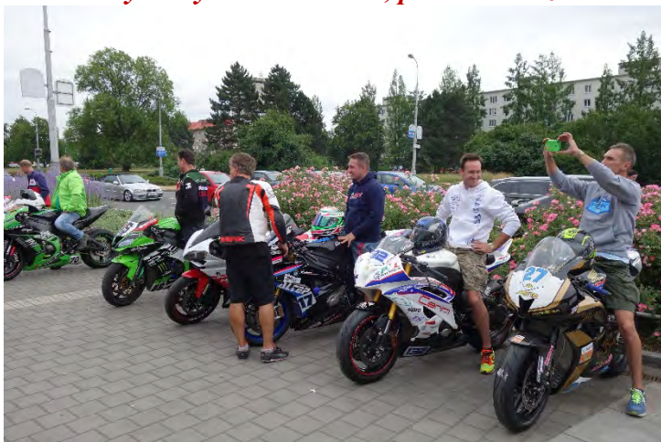
Haviřovský Zlatý kahanec 2019, představení závodníků u OC Elan.