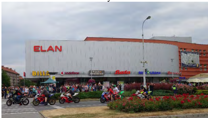
Haviřovský Zlatý kahanec 2019, závodníci se představili veřejnosti u OC Elan.

36. ročník oblíbeného motocyklového závodu. Foceno u OC Elan a na Bludovickém kopci.