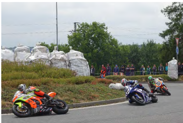
Haviřovský Zlatý kahanec 2019, závod IRRC SB, souboj na kruhovém objezdu na Bludovickém kopci. Neděle 14. července 2019.