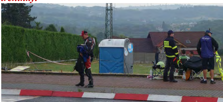
Haviřovský Zlatý kahanec 2019, na trati, měřené tréninky.