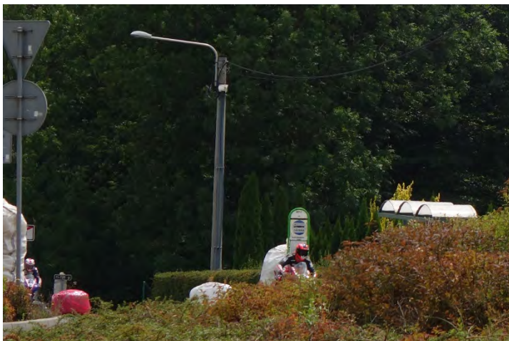
Havířovský Zlatý kahanec 2019, závody do 600 ccm, show začíná. Neděle 14. července 2019.