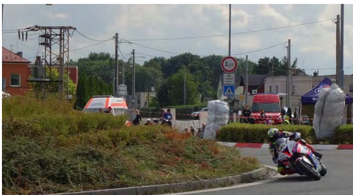
Haviřovský Zlatý kahanec 2019, měřené tréninky v sobotu 13. července 2019.