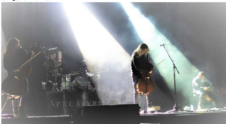
Začal noční koncert finské Apocalypticy. Nezapomenutelný zážitek z Havířovských slavností 2018, sobota 8. září 2018. Přijeli fanoušci nejen z České republiky.