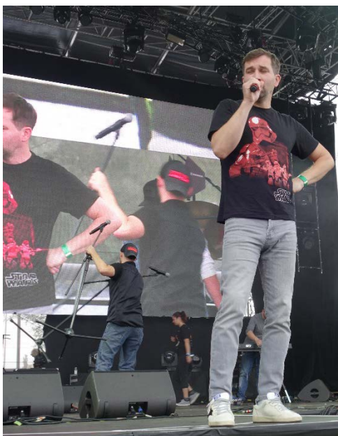
Havířovské slavnosti v sobotu moderoval Ondřej Sokol. Sobota 8. září 2018.