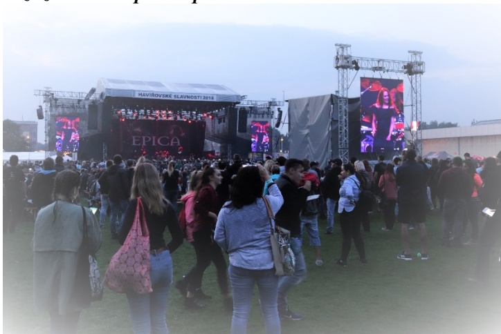
Epica a videoprojekce pro všechny, kteří stojí dále od jeviště. Sobota 8. září 2018, Havířovské slavnosti.