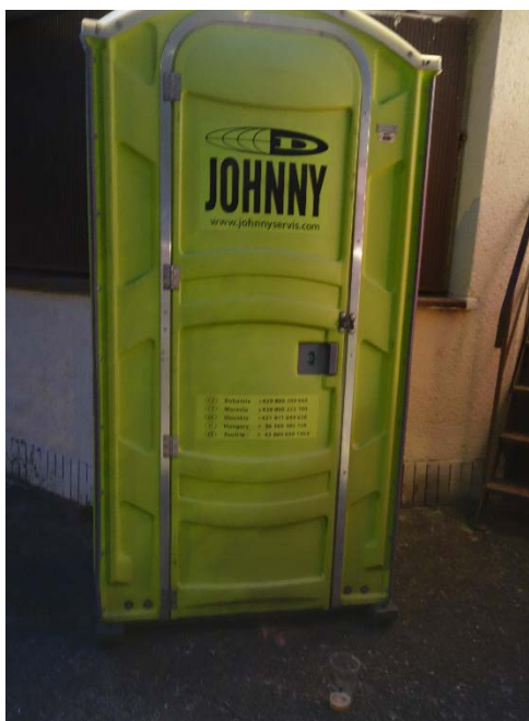
Podivné zátíší z Havířovských slavností 2018, pátek 7. září 2018.