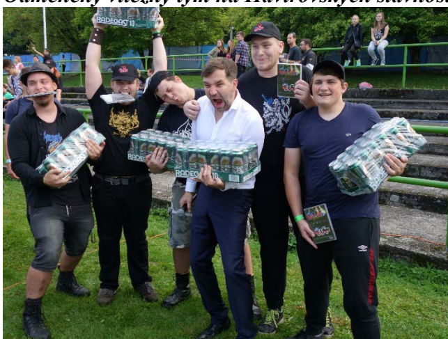
Vítězové s moderátorem. Havířovské slavnosti 2018, sobota 8. září 2018.