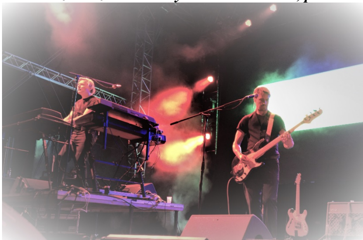
Na slavnostech vystoupila kapela Tata Bojs. Pátek 7. září 2018.