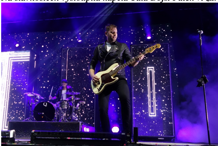
Následovala skupina Mandrage. Pátek 7. září 2018.