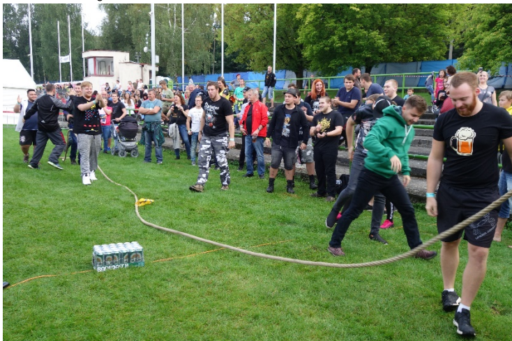
Boje ztížil rozmočený povrch, jeden z účastníků soutěže si způsobil zranění nohy. Sobota 8. září 2018, Havířovské slavnosti.