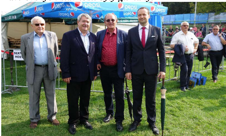
Před volbami se dorazili pobavit lídři stran a hnutí. Představitelé KSČM v sobotu 8. září 2018.