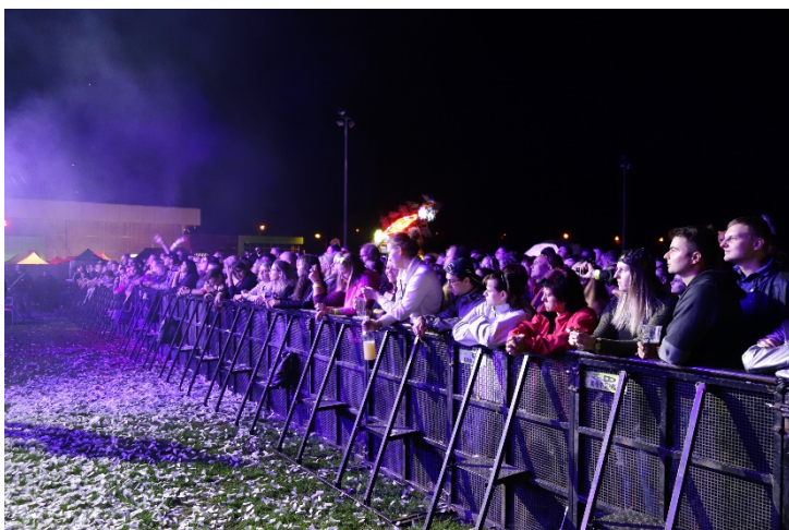
Návštěvníci Havířovských slavností čekají na vystoupení hvězdy večera, slovenské kapely Elán, která svým koncertem slavila 50. výročí své existence. Pátek 7. září 2018.