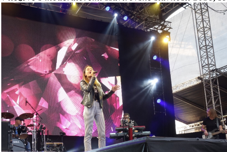
Michal David přivádí na jeviště i mladé umělce. Sobota 8. září 2018.