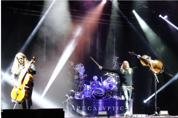
Jedinečná show finské kapely, která aranžuje heavy metal pro smyčce.