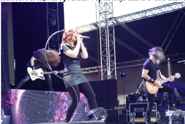
Skvělá muzika, nádherný hlas, prvky death metalového chrapotu, to všechno představuje nizozemská kapela Epica.