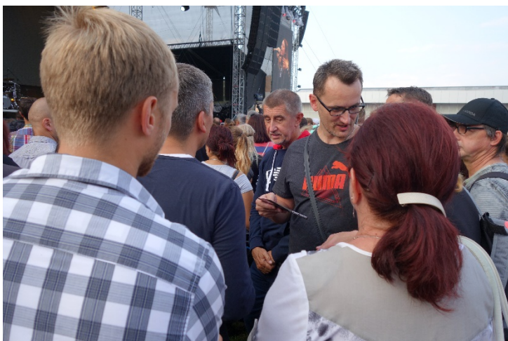
Koncert si užíval i premiér republiky. Havířovské slavnosti, sobota 8. září 2018.