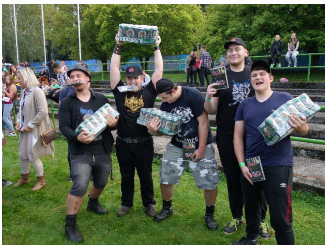
Odměněný vítězný tým na Havířovských slavnostech 2018, sobota 8. září 2018.