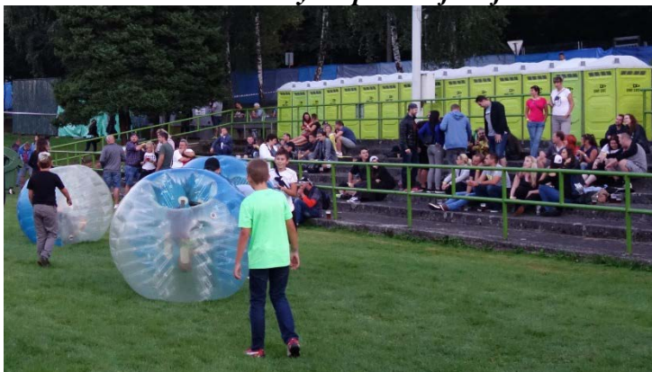
Řadu atrakcí připravili pořadatelé z Městského kulturního střediska pro děti. Pátek 7. září 2018.