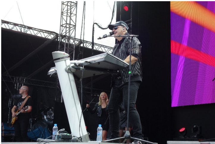
S kapelou a oblíbenými písničkami přijel na Havířovské slavnosti 2018 showman Michal David. Sobota 8. září 2018.