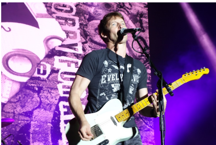
Další hvězda na Havířovských slavnostech 2018. James Blunt, Angličan se smyslem pro humor, hezkými písničkami. V pohodovém koncertu se snažil mluvit česky. Sobota 8. září 2018.