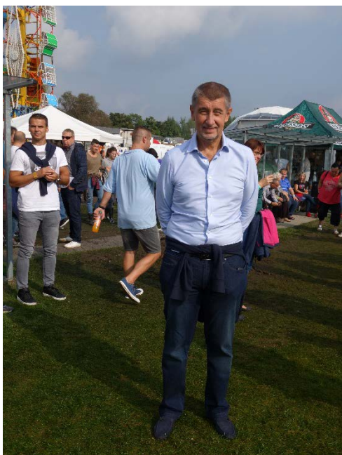
V sobotu 8. září 2018 dorazil na Havířovské slavnosti premiér České republiky Andrej Babiš.