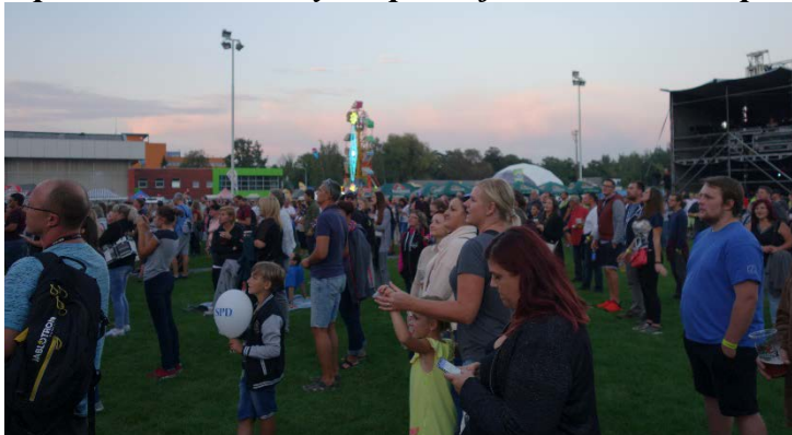
Havířovské slavnosti obvykle přitahují nejen Havířovany. Pátek 7. září 2018.