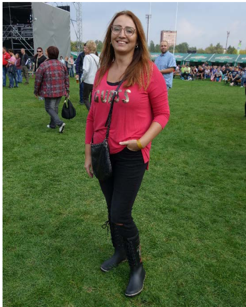
V sobotu 8. září 2018 dopoledne lilo jako z konve. Častým obutím návštěvníků Havířovských slavností byly gumáky.