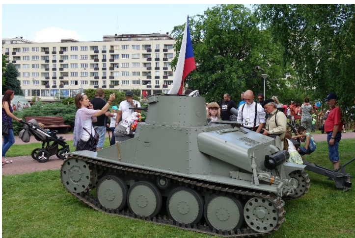
Haviřov v květech v sobotu 16. června 2018 v Centrálním parku.