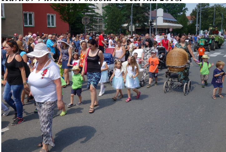
Haviřov v květech v sobotu 16. června 2018.