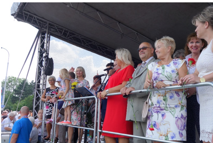
Haviřov v květech v sobotu 16. června 2018. Vedoucí představitelé města na tribuně u náměstí Republiky.