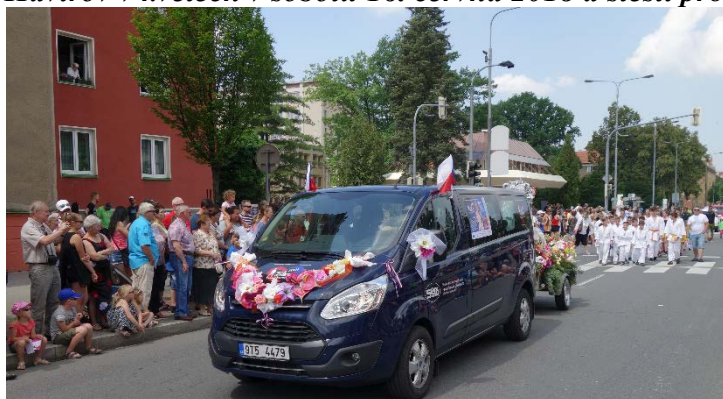
Haviřov v květech v sobotu 16. června 2018.