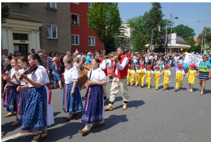
Pestrý, veselý a plný hudby a tanců, takový byl průvod Havířova v květech v sobotu 16. června 2018.