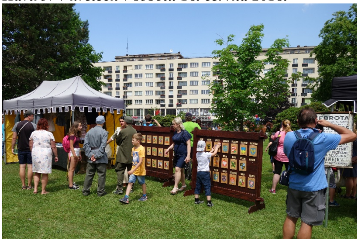
Haviřov v květech v sobotu 16. června 2018 v Centrálním parku.