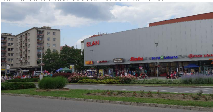
Haviřov v květech v sobotu 16. června 2018. Na Hlavní třídě ani autíčko, průjezd Haviřovem byl celý den uzavřen.