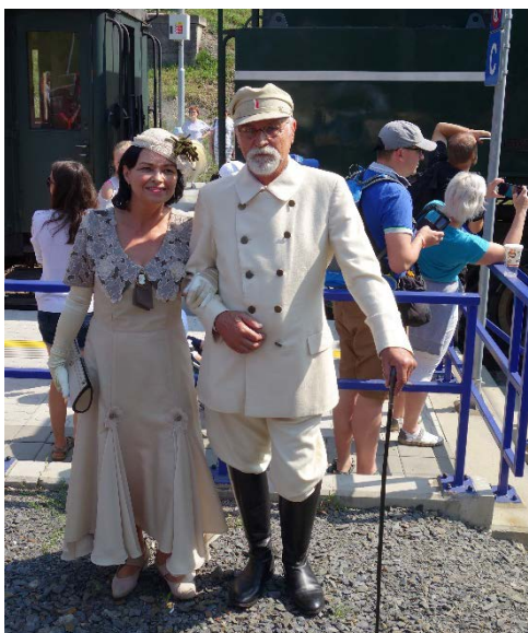
Přijel „prezident Masaryk s dcerou Alicí“. Havířov v květech v sobotu 16. června 2018.