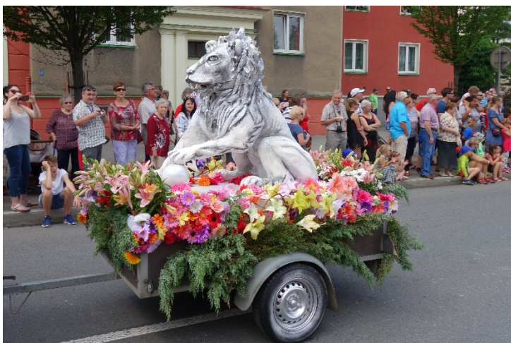
Havířov v květech v sobotu 16. června 2018.