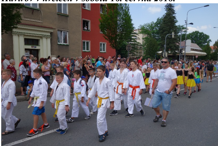
Havířov v květech v sobotu 16. června 2018.