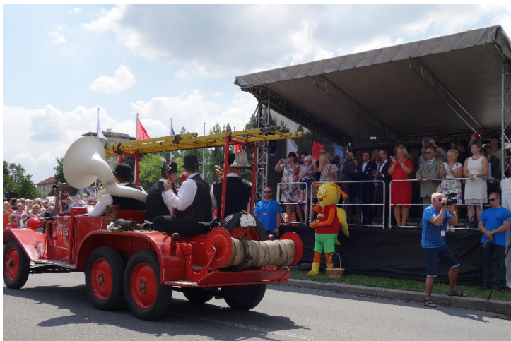
Haviřov v květech v sobotu 16. června 2018. Na náměstí Republiky vítali všechny účastníky průvodu představitelé města na tribuně.