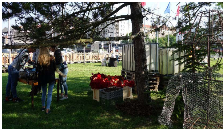
Floristé začali tvořit květinové sochy postaviček z Večerníčků. Havířov v květech v sobotu 16. června 2018.