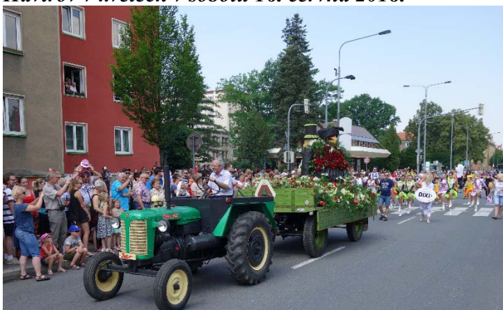
Haviřov v květech v sobotu 16. června 2018.