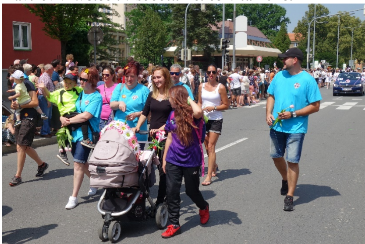
Haviřov v květech v sobotu 16. června 2018.