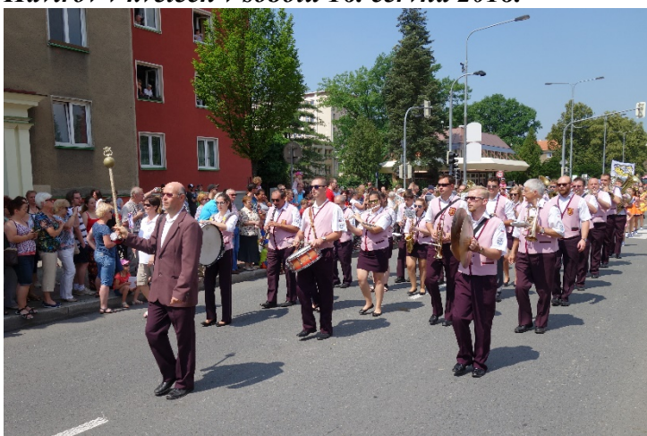
Haviřov v květech v sobotu 16. června 2018.