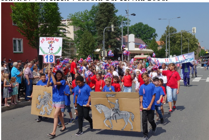
Haviřov v květech v sobotu 16. června 2018.