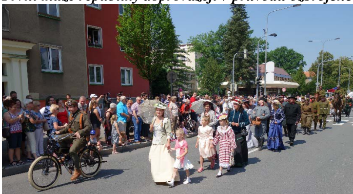
Havířov v květech 16. června 2018 byl krásnou oslavou 100. výročí založení samostatného Československa.