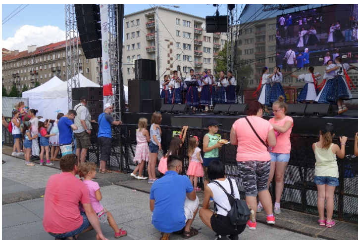
Haviřov v květech v sobotu 16. června 2018. Odpolední bohatý program na pódiu na náměstí Republiky i v nedalekém Centrálním parku.