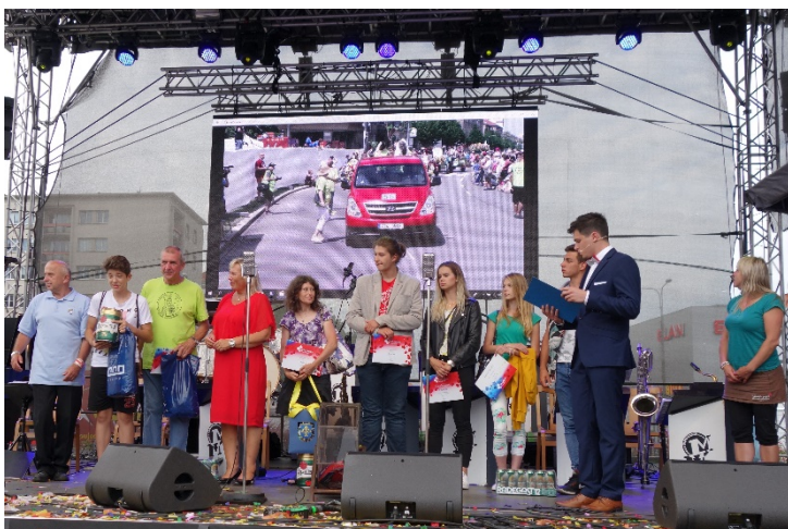
Tvůrci alegorických vozů a večerníčkových soch, kteří dostali od hlasujících nejvíce bodů, byli oceněni a odměněni. Havířov v květech v sobotu 16. června 2018.