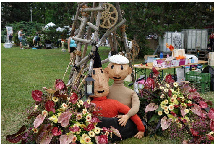
Haviřov v květech v sobotu 16. června 2018. Díla floristů: oblíbení Pat a Mat z večerníčku A je to!