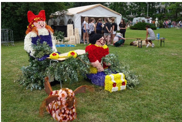
Haviřov v květech v sobotu 16. června 2018. Díla floristů: z večerníčku o Machu, Šebestové a psu Jonatánovi a jejich utrženém sluchátku.