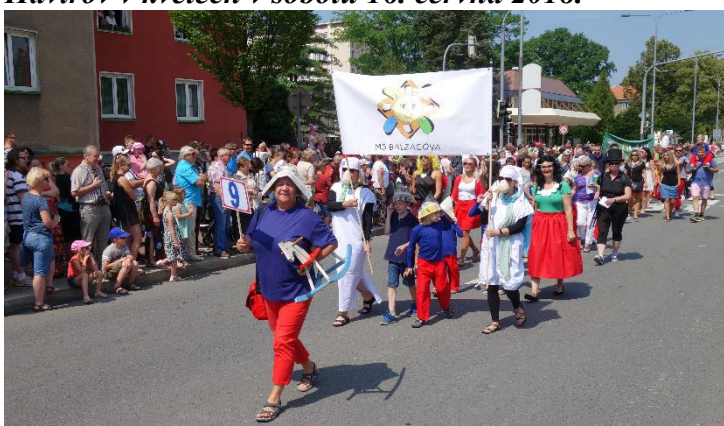
Haviřov v květech v sobotu 16. června 2018.