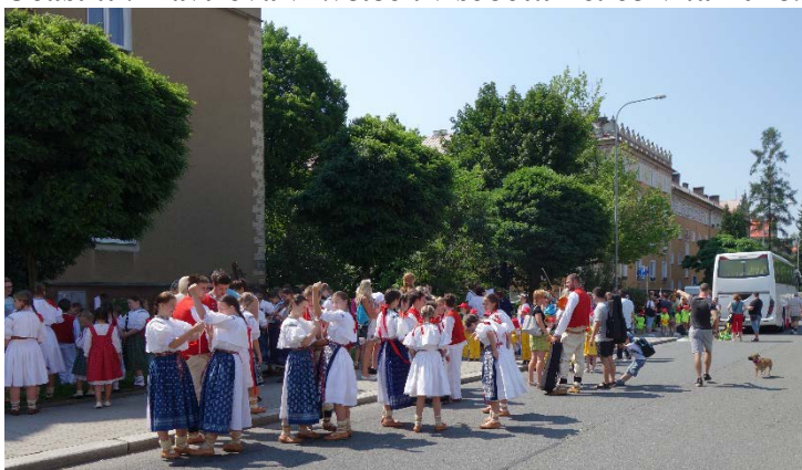
Začíná se řadit průvod Havířova v květech v sobotu 16. června 2018.