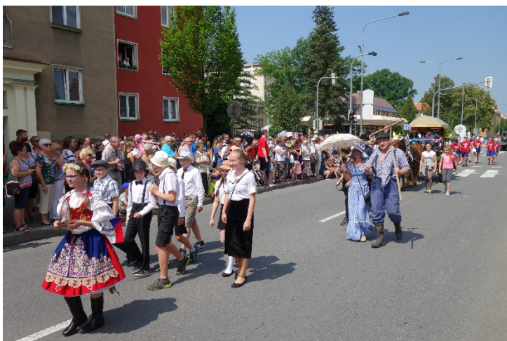
Haviřov v květech v sobotu 16. června 2018.