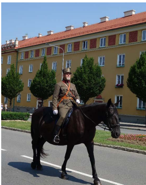
Řazení čela průvodu Havířova v květech v sobotu 16. června 2018.