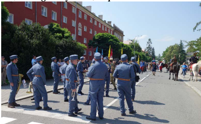
Řazení průvodu Havířova v květech v sobotu 16. června 2018.