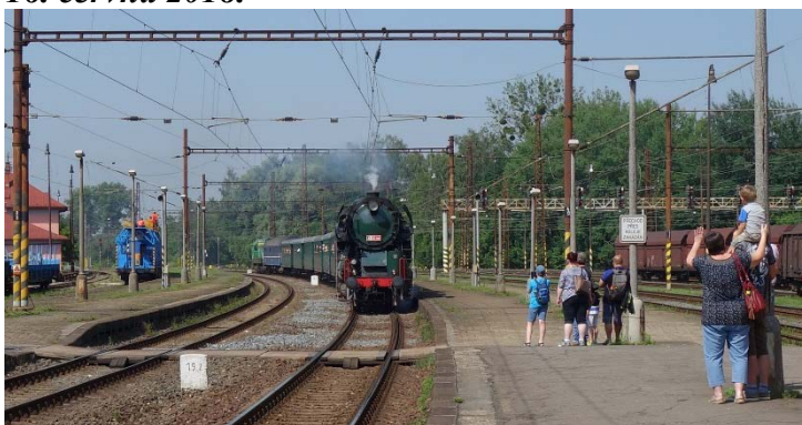
Historický vlak přiváží na havířovské vlakové nádraží prezidenta Masaryka s dcerou Alicí.