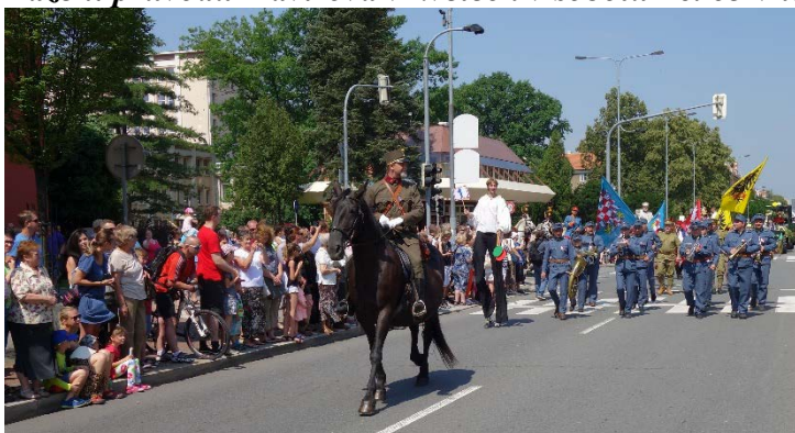
Průvod se vypravil na cestu centrem města Havířova. Sobota 16. června 2018.