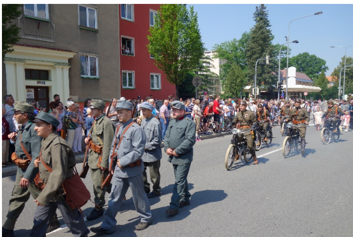
První muže republiky doprovázejí v průvodu ozbrojené složky. Sobota 16. června 2018.