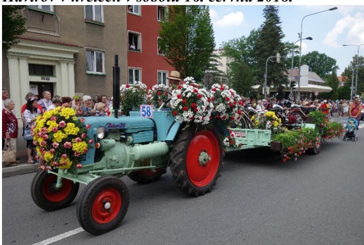
Haviřov v květech v sobotu 16. června 2018.