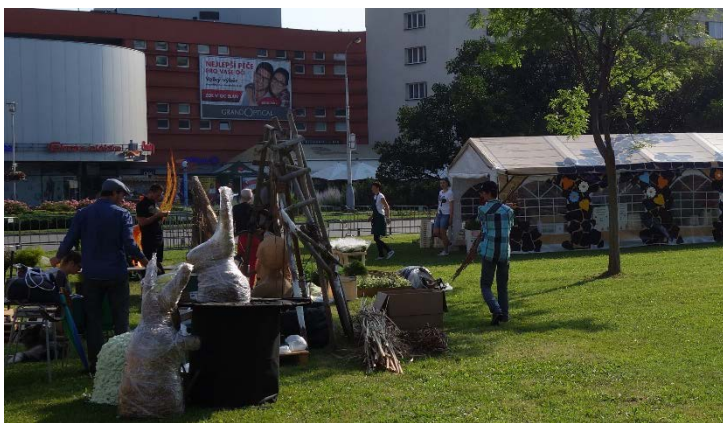
Floristé začínají tvořit květinové sochy postaviček z Večerníčků. Havířov v květech v sobotu 16. června 2018.