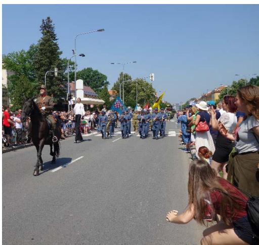
Průvod se vydal na cestu. Havířov v květech sobota 16. června 2018.