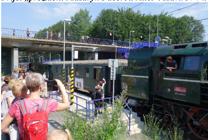
Lidé vítali vlak i na zastávce Havířov-Střed. Sobota 16. června 2018.