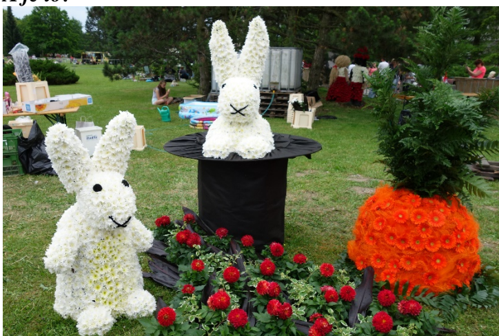
Haviřov v květech v sobotu 16. června 2018. Díla floristů: vítězní Bob a Bobek, králíci z klobouku.