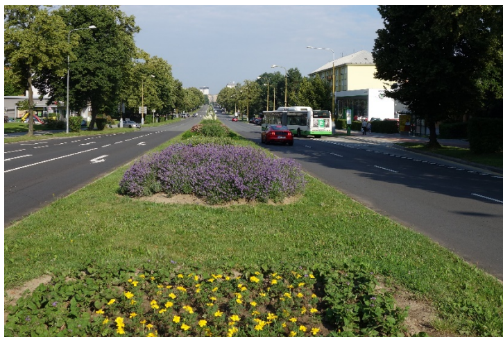
Slavnostní den začíná, Havířov v květech v sobotu 16. června 2018.