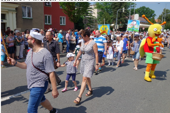
Haviřov v květech v sobotu 16. června 2018. Nechyběl ani maskot Floriánek.