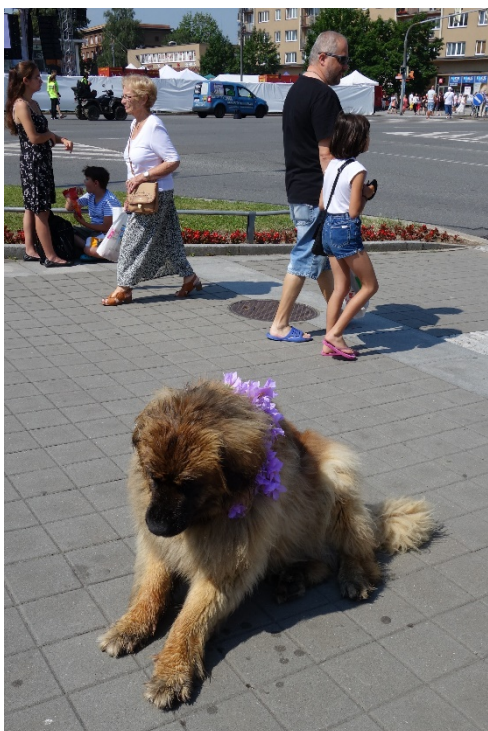
Účastník Havířova v květech v sobotu 16. června 2018.