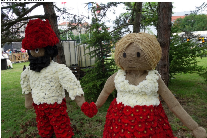
Haviřov v květech v sobotu 16. června 2018. Díla floristů: z večerníčku O loupežníku Rumcajsovi a jeho Mance.