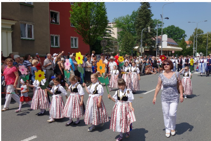
Haviřov v květech v sobotu 16. června 2018.