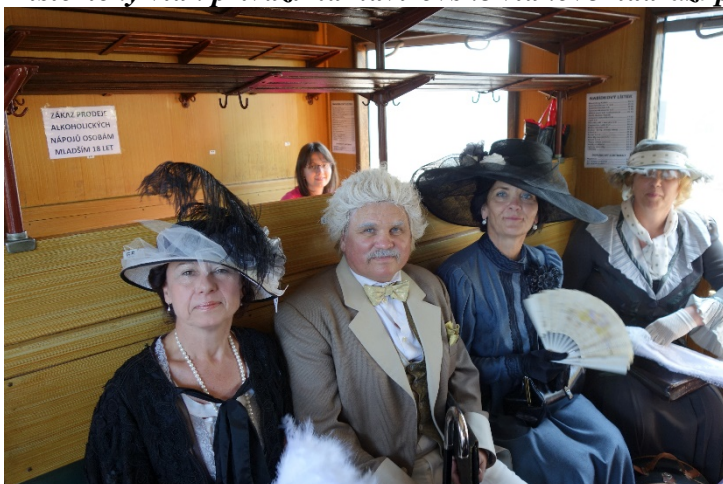
Cestující v prvorepublikovém vlaku, který pendloval mezi Ostravou a Českým Těšínem v sobotu 16. června 2018.