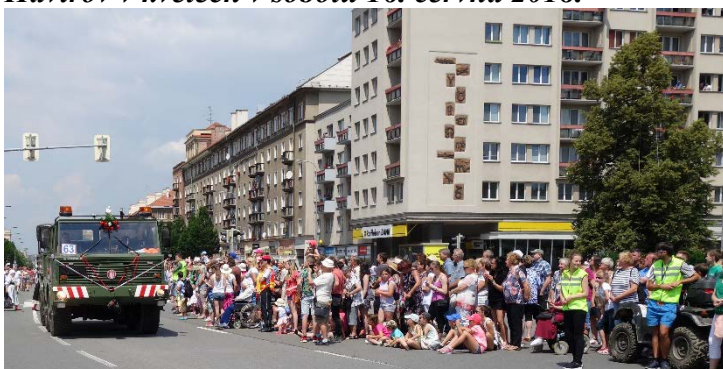
Haviřov v květech v sobotu 16. června 2018. Po veteránech se představila současná vojenská technika.