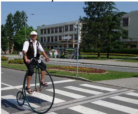
Řazení do průvodu Havířova v květech v sobotu 16. června 2018.