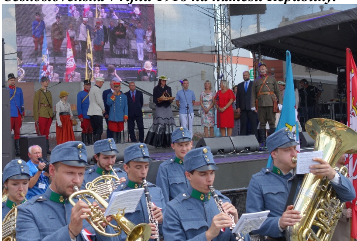
Haviřov v květech v sobotu 16. června 2018. Slavnostní ceremoniál na náměstí Republiky.