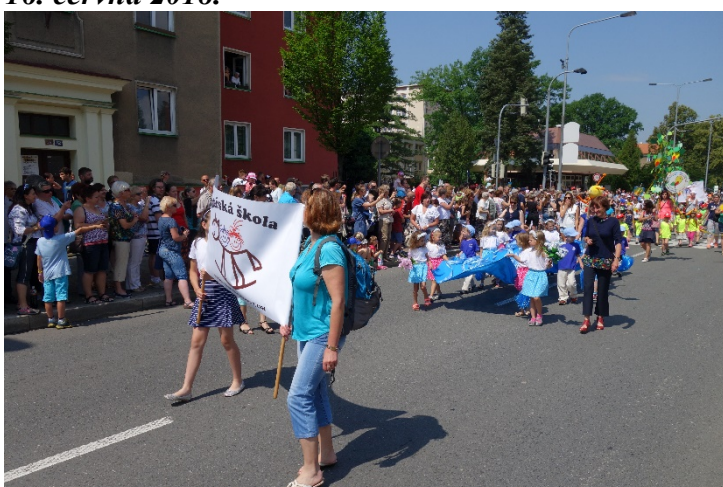
Prezentovaly se školy mateřské, základní i střední, sportovci, tanečníci, veřejnost... Havířov v květech sobota 16. června 2018.