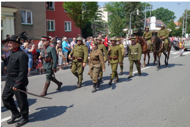
Havířov v květech v sobotu 16. června 2018.