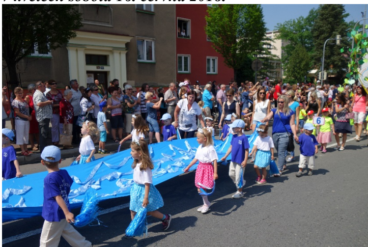
Havířov v květech v sobotu 16. června 2018.