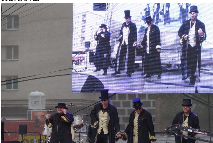
Haviřov v květech v sobotu 16. června 2018 a skvělý 4TET.