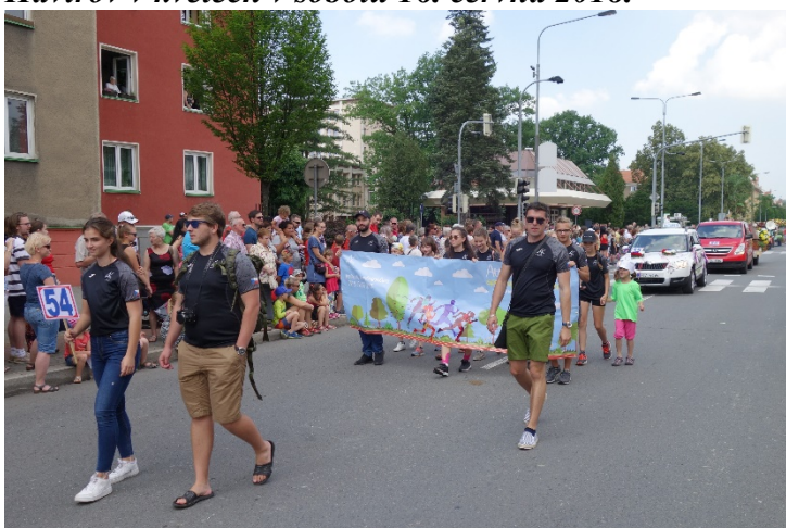
Havířov v květech v sobotu 16. června 2018.