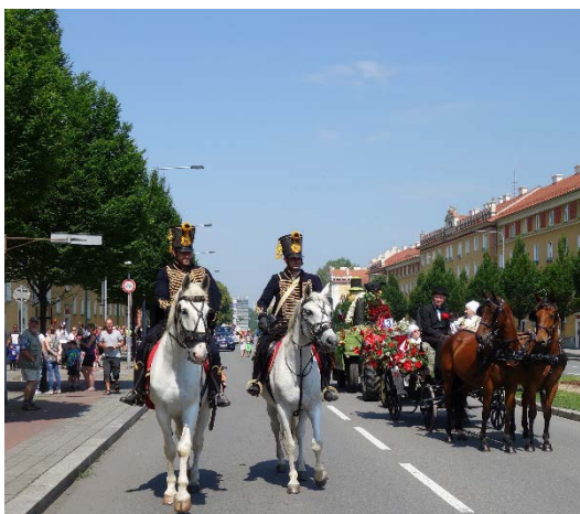
Řazení průvodu Havířova v květech v sobotu 16. června 2018.