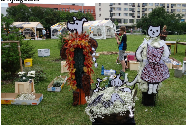
Haviřov v květech v sobotu 16. června 2018. Díla floristů: večerníček O Pejskovi a Kočičce.