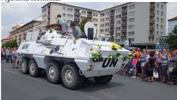
Haviřov v květech v sobotu 16. června 2018.