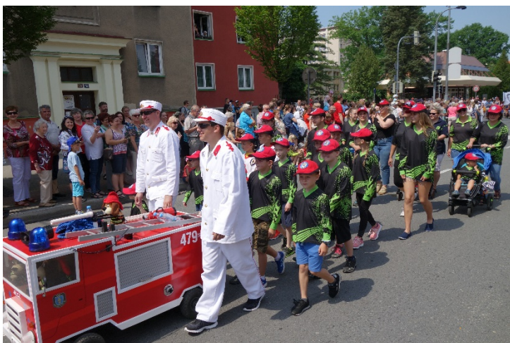
Haviřov v květech v sobotu 16. června 2018.