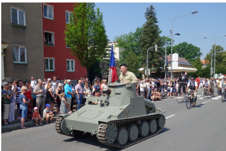
Haviřov v květech v sobotu 16. června 2018.