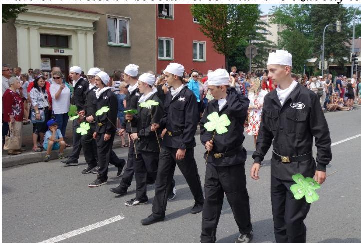
Haviřov v květech v sobotu 16. června 2018 a štěstí pro všechny...