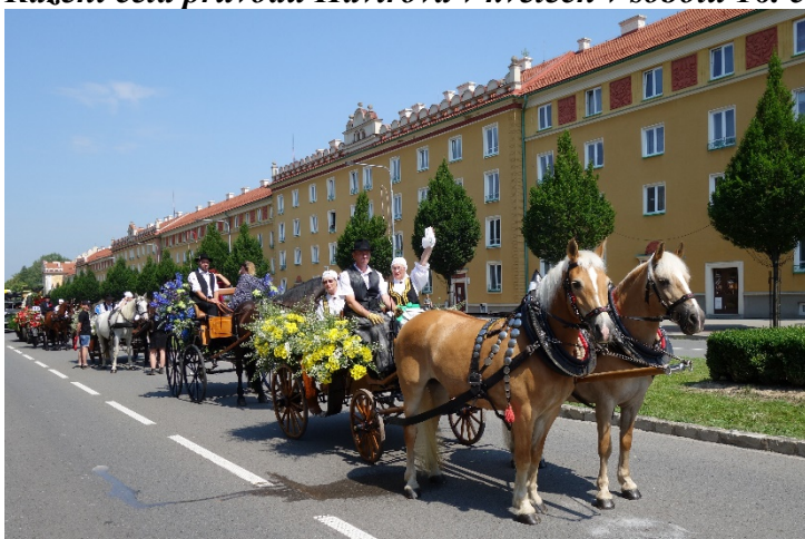
Řazení průvodu Havířova v květech v sobotu 16. června 2018.