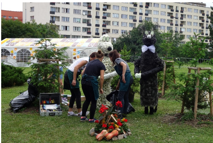
Haviřov v květech v sobotu 16. června 2018. Díla floristů: večerníček O Štaflíkovi a Špagetce.