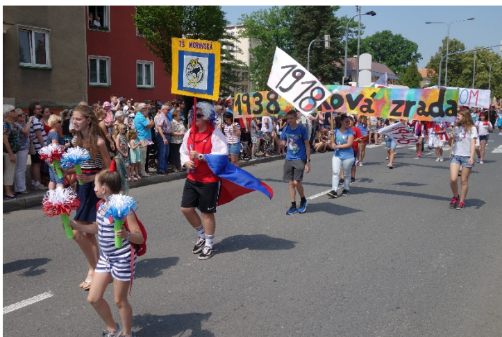
Haviřov v květech v sobotu 16. června 2018.