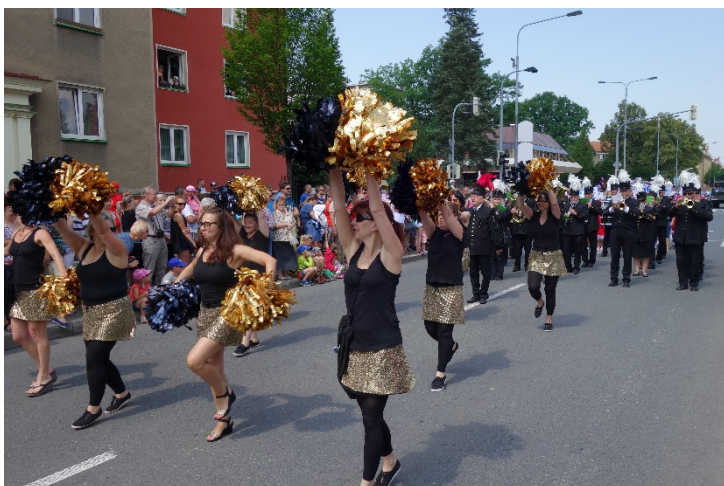
Haviřov v květech v sobotu 16. června 2018.