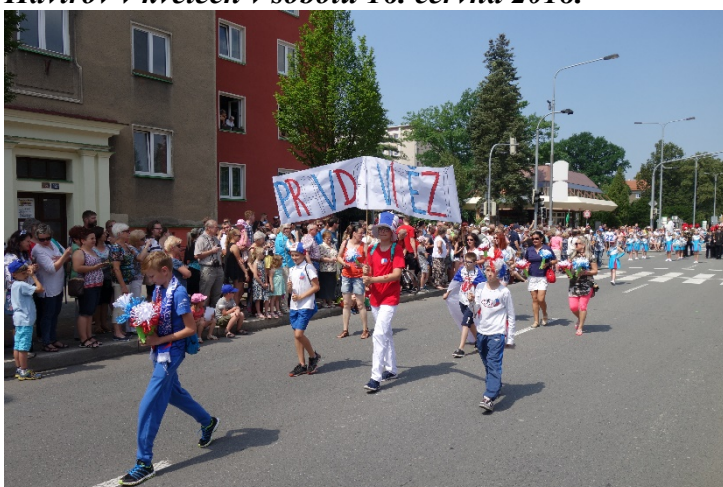
Haviřov v květech v sobotu 16. června 2018.