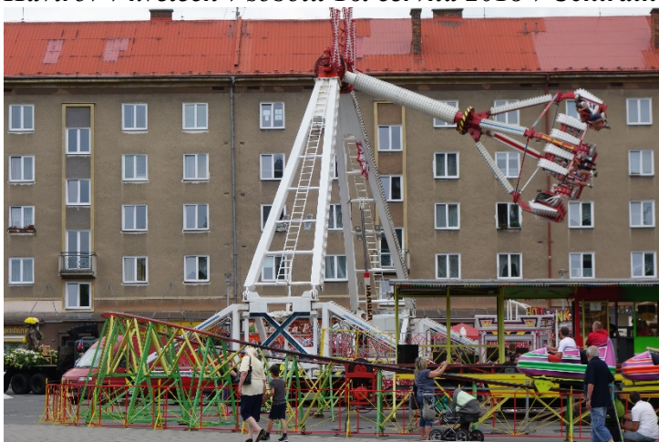
Haviřov v květech si vybral krásné počasí. Děti i dospělí se vyřádili i na kolotočích na Národní třídě. Sobota 16. června 2018.