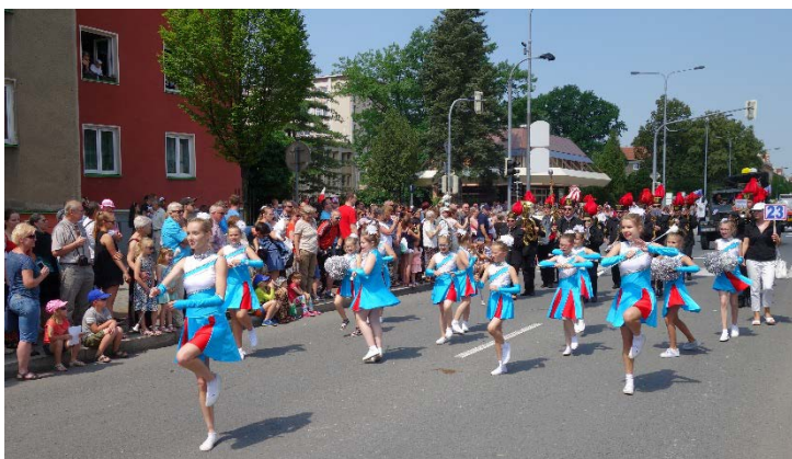
Haviřov v květech v sobotu 16. června 2018.