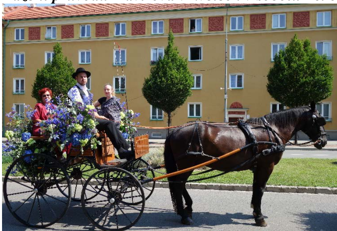
Řazení alegorických vozů v průvodu Havířova v květech v sobotu 16. června 2018.