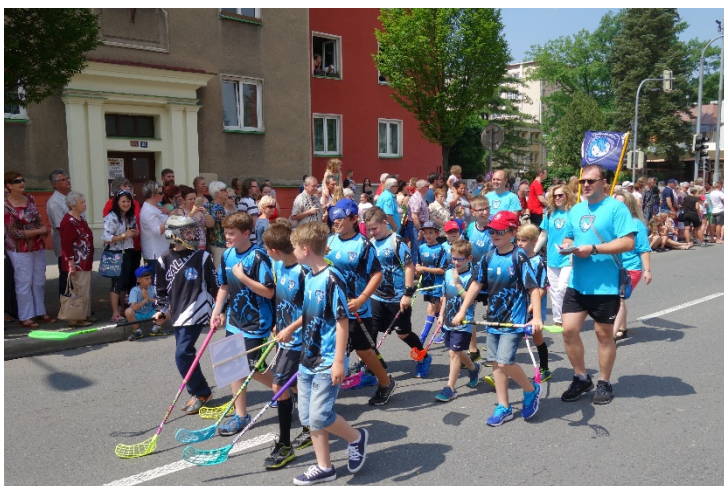
Haviřov v květech v sobotu 16. června 2018.