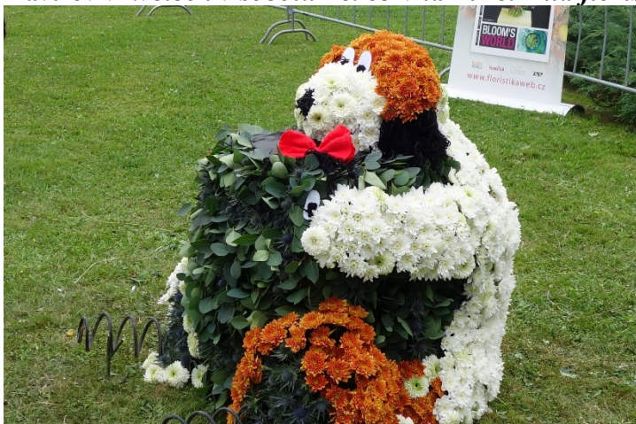
Haviřov v květech v sobotu 16. června 2018. Díla floristů: oblíbený večerníček Maxipes Fík.