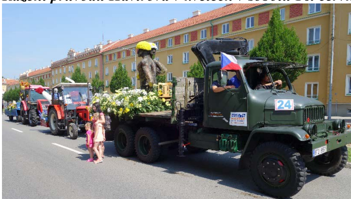
Řazení alegorických vozů v průvodu Havířova v květech v sobotu 16. června 2018.