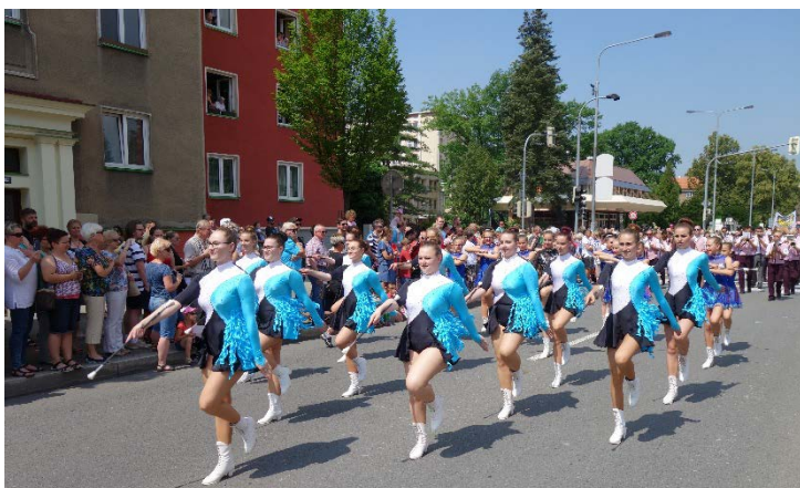
Haviřov v květech v sobotu 16. června 2018.