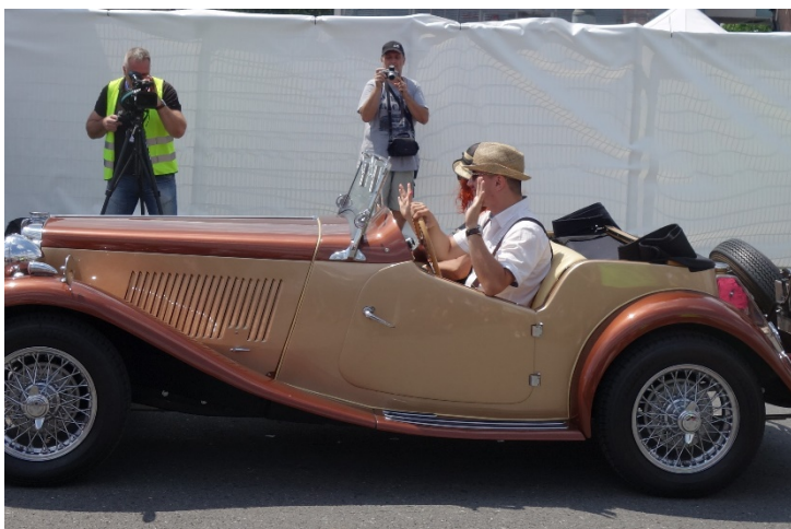
Haviřov v květech v sobotu 16. června 2018.