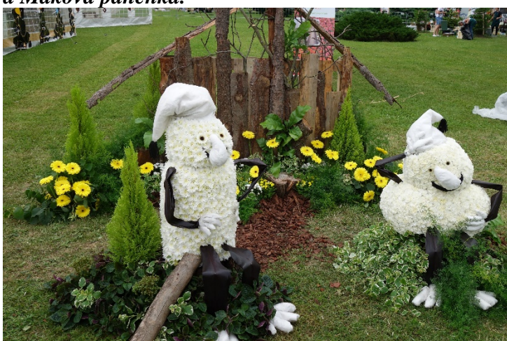
Haviřov v květech v sobotu 16. června 2018. Díla floristů: z večerníčku o Křemílku a Vochomůrkovi z pařezové chaloupky.