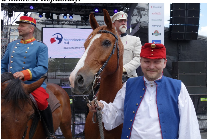
Haviřov v květech v sobotu 16. června 2018. Slavnostní ceremoniál k založení samostatného Československa v říjnu 1918 na náměstí Republiky.