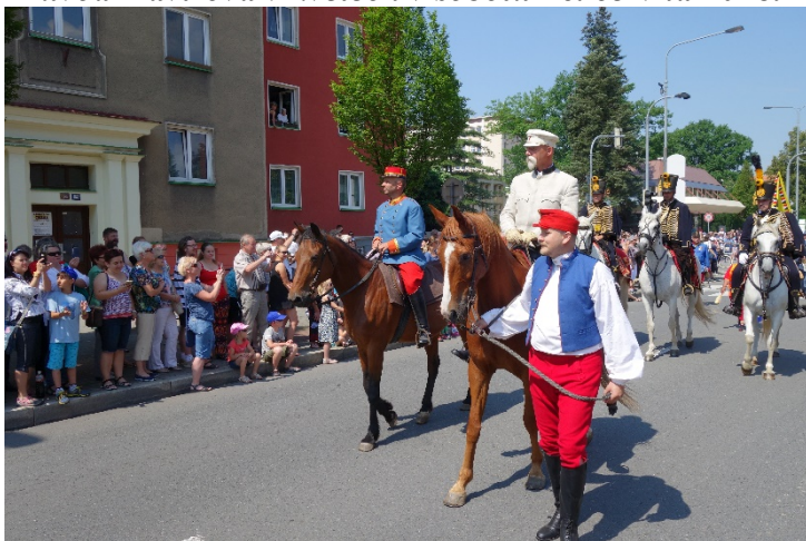
Průvodu vévodili prezident Masaryk a generál Štefánik. Sobota 16. června 2018.