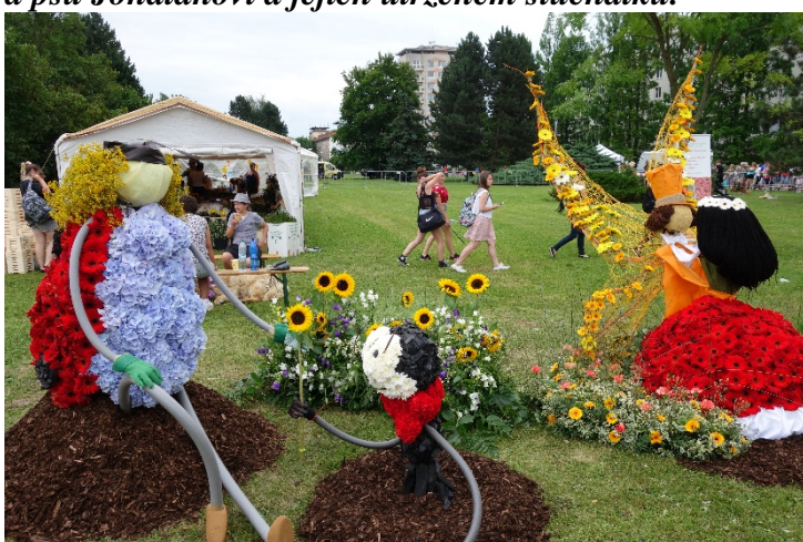
Haviřov v květech v sobotu 16. června 2018. Díla floristů: z večerníčků Ferda Mravenec a Maková panenka.