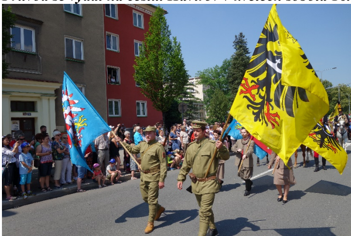
Průvod Havířova v květech v sobotu 16. června 2018.