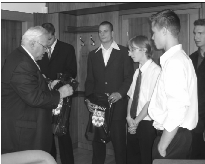
Úspěšní žáci SŠ technických oborů na setkání s primátorem města.