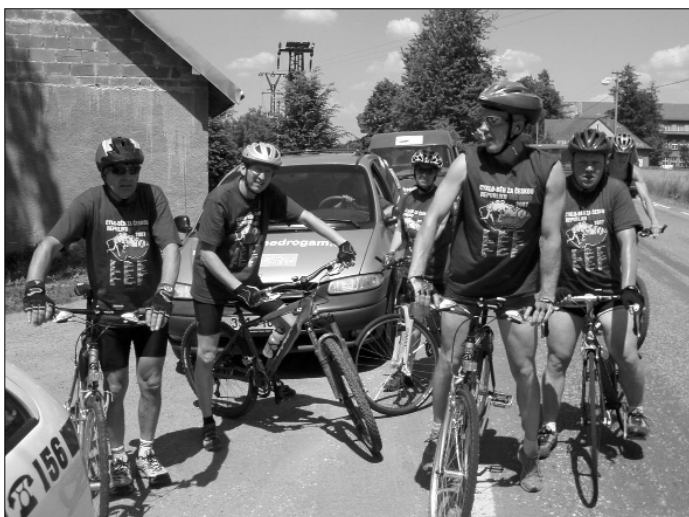
Účastníci Cyklo-běhu se rozloučili s Havířovem na hranici města v Horních Bludovicích a vydali se do Frenštátu a Vsetína.