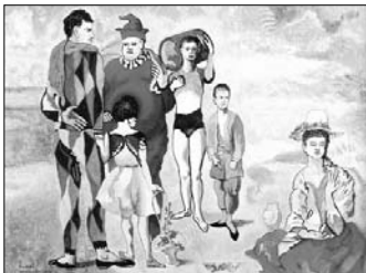
Transkripce obrazu Pabla Picassa Provazochodci (Kejklířská rodina)

vernisaž v úterý 30.1. od 17 h, výstava končí 2.3. 2007