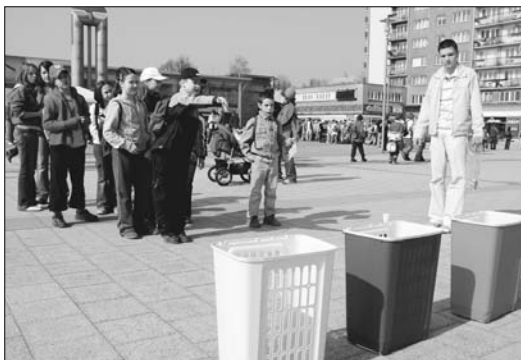
Krmění draka - házení na cíl koulemi z odpadového materiálu.