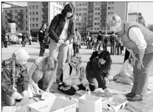
Výroba dárkových obalů z papíru s motivem ochrany životního prostředí.