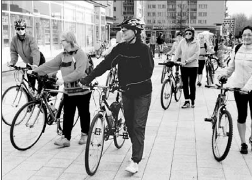
Také magistrát se zapojil propagací ochrany životního prostředí a zdravého životního stylu, a to propagační jízdou úředníků na kole podél budoucích cyklistických stezek.