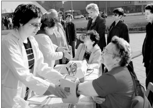
Stanoviště hygienické stanice: měření cholesterolu, krevního tlaku, tělního tuku, program odvykání kouření a zdravého životního stylu.

Letošní „DEN ZEMĚ“, celosvětová akce zaměřená na ekologii a zdravé životní prostředí, se v Havířově konal pod taktovkou odboru školství a kultury havířovského magistrátu. Centrum dění se soustředovalo v prostorách náměstí Republiky, kde byl 21. dubna od 9 hodin připraven bohatý program. Ve fotoreporáži Josefa Talaše se můžete seznámit s nejdůležitějšími stanovišti a body programu.