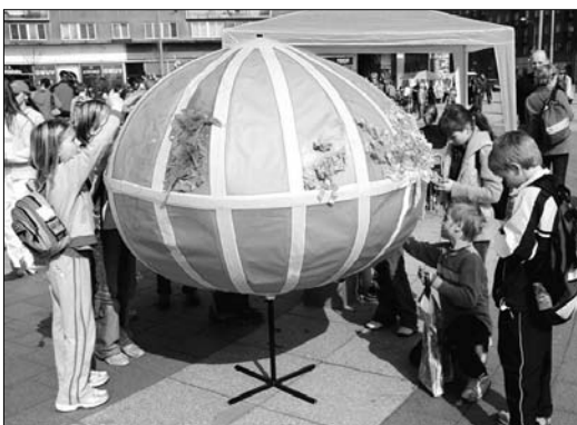
Vytváření barevné zeměkoule z krepových proužků.