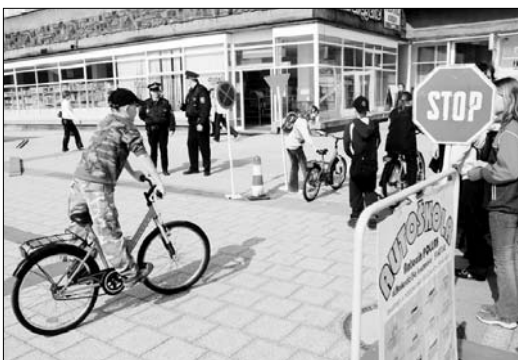
Stanoviště s řízenou křížovatkou a jízda zručnosti pod dohledem strážníků městské policie.